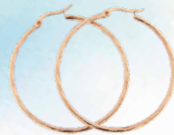
CREOLEN bei LeClou um € 29,-