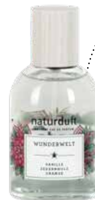
EAU DE PARFUM, 50 ML bei dm um € 9,95