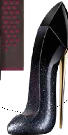
EAU DE PARFUM, 50 ML bei Douglas um € 99,95