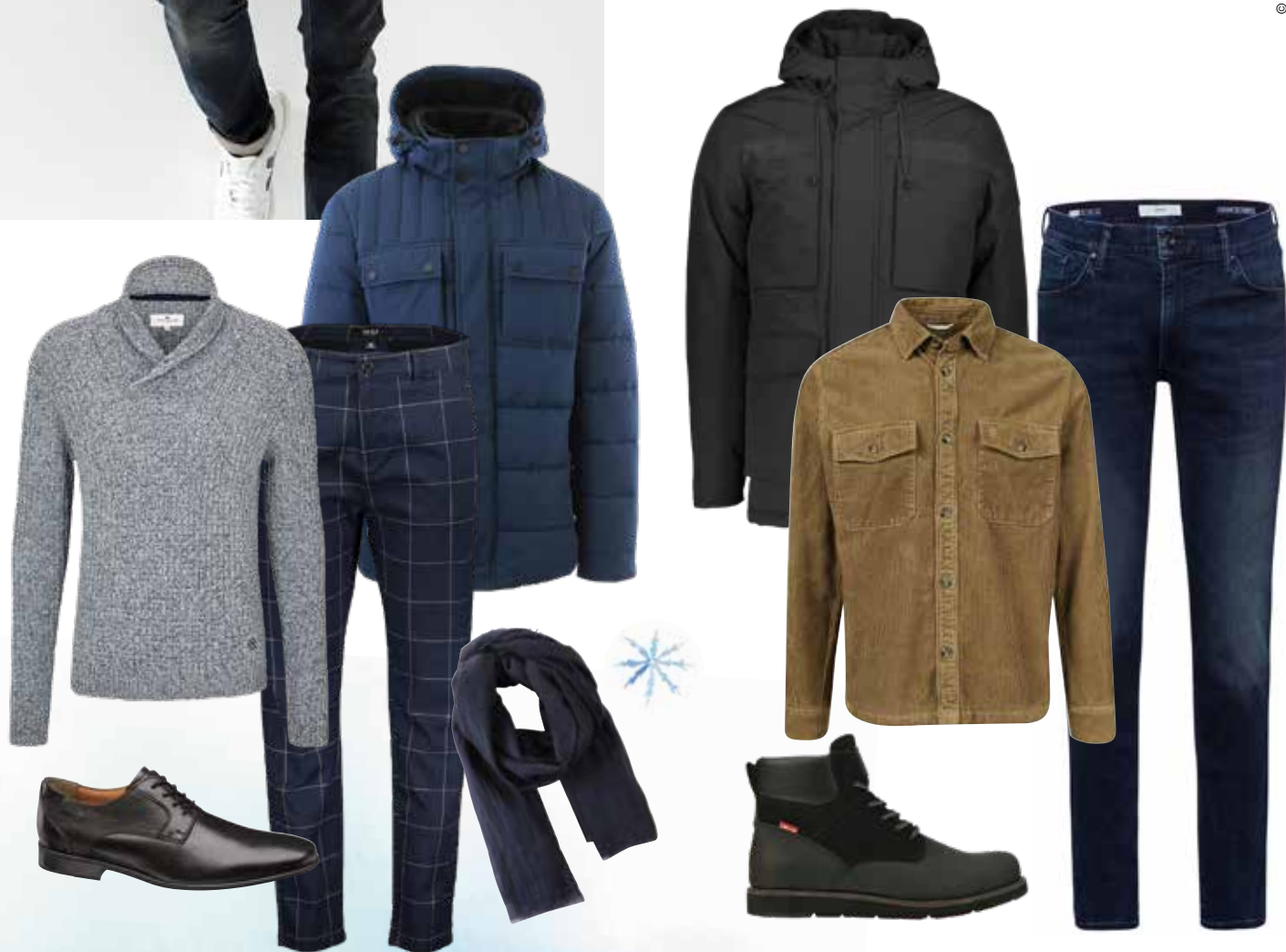
JACKE bei Fussl um € 99,99 PULLOVER bei Tom Tailor um € 59,99 HOSE bei New Yorker um € 24,99 LEDERSCHNÜRER bei Deichmann um € 49,90 SCHAL bei Fussl um € 19,99