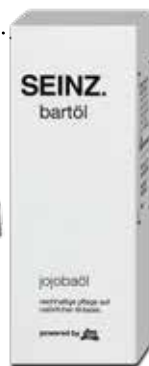
BARTÖL bei dm um € 4,95