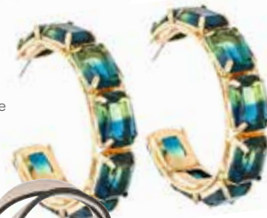
OHRRINGE bei Bijou Brigitte um € 24,95