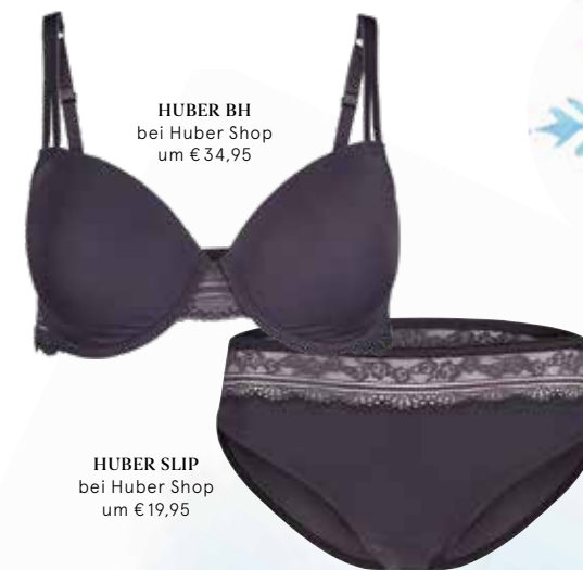
HUBER SLIP bei Huber Shop um € 19,95