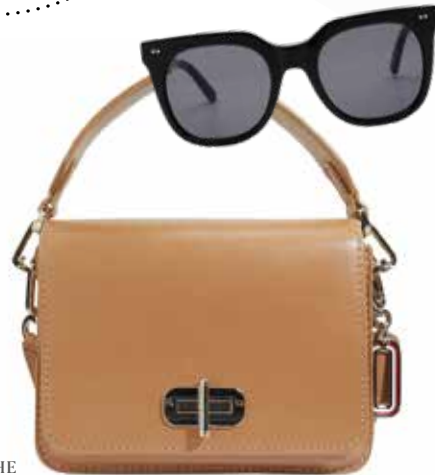
TASCHE bei Kastner & Öhler um € 229,90