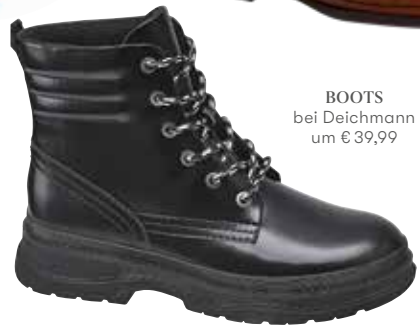
BOOTS bei Deichmann um € 39,99