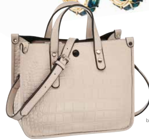
TASCHE bei Deichmann um € 22,99

Funkelnd Glitzernd wie Schnee, Eis und der Sternenhimmel: Trau Dich einfach!