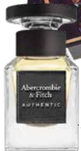
EAU DE TOILETTE 50 ML bei Douglas um € 48,95