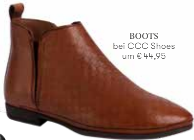
BOOTS bei CCC Shoes um € 44,95