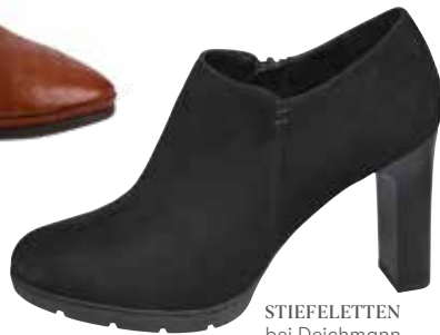
STIEFELETTEN bei Deichmann um € 27,99