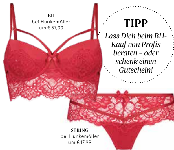
STRING bei Hunkemöller um € 17,99

TIPP Lass Dich beim BH-Kauf von Profis beraten – oder schenk einen Gutschein!