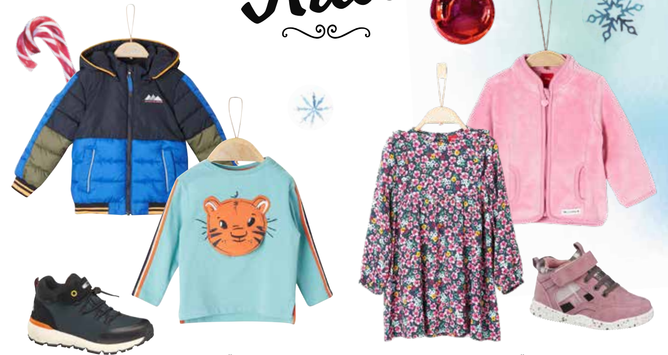
JACKE bei Kastner & Öhler um € 69,99 SHIRT bei Kastner & Öhler um € 15,99 SNEAKERS bei Deichmann um € 39,99